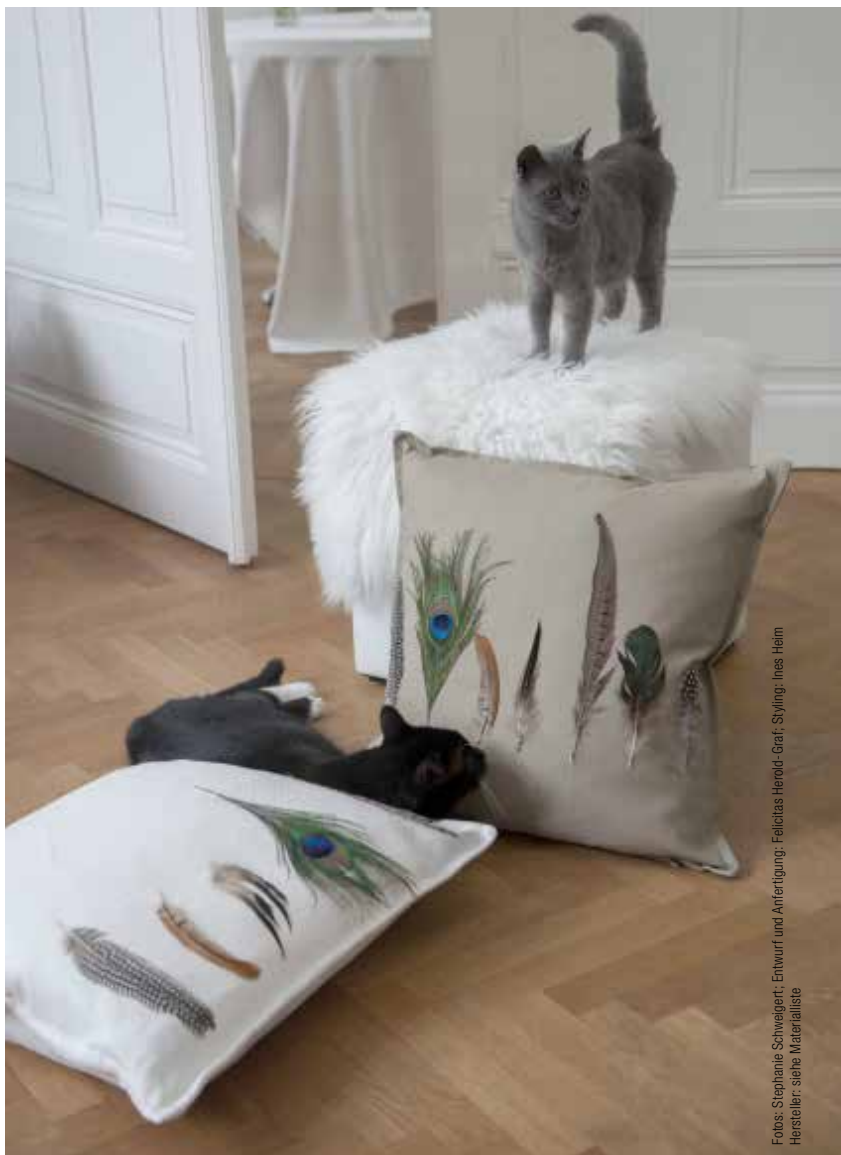
Entwurf und Anfertigung: Felicitas Herold-Grat; Styling: Ines Heim Hersteller: siehe Materialliste