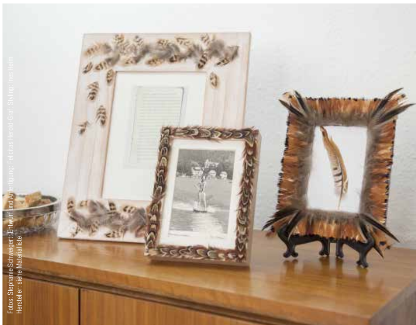
Entwurf und Anfertigung: Felicitas Herold, Craft, Styling: Ines Helm Hersteller: siehe Materialliste