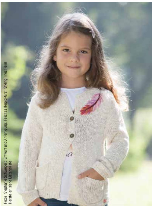
Entwurf und Anfertigung: Felicitas Högel-Graf; Styling: Ines Heim Hersteller: siehe Materialliste